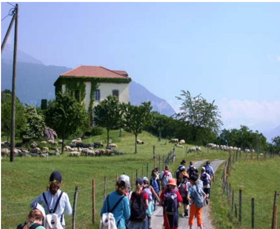
auf einer gemeinsamen Wanderung....