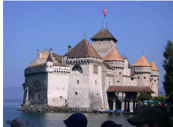
Das Schloss Chillon besuchen oder...

Fast nirgendwo wird Erdgeschichte sichtbarer als im Salzbergwerk in Bex oder in den Tropfsteinhöhlen der Orbe. Das Wachstum von 1 cm in 100 Jahren der Stalagmiten und Stalaktiten, lässt staunen und lässt Zeit erahnen. Auf diese Erlebnisse freuen sich die 3. und 4. Klässler.