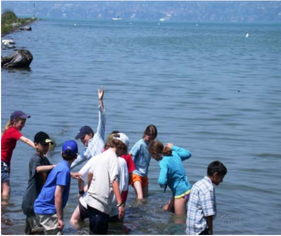
..... ob am oder im Wasser...