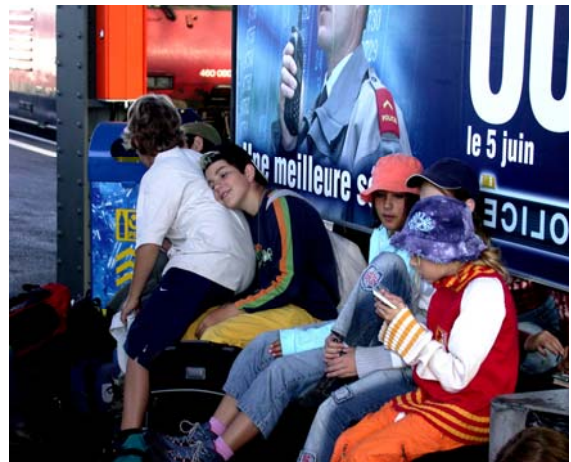
Das gemeinsame Erlebnis ist garantiert!