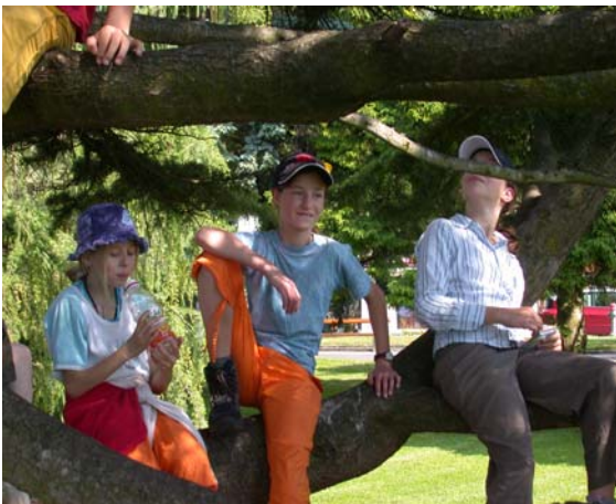
auf einem Baum...