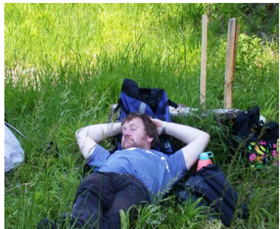
Auch wenn der Lehrer seine wohlverdiente Siesta abhält.

Fotoimpressionen der Geografie Exkursion vom 1. bis 3. Juni 2005