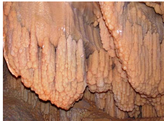
die Stalaktiten in der Höhle von Orbe bestaunen...