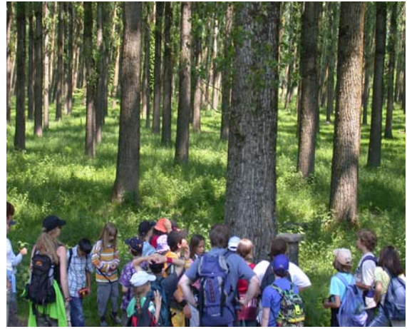
oder staunend im Wald....